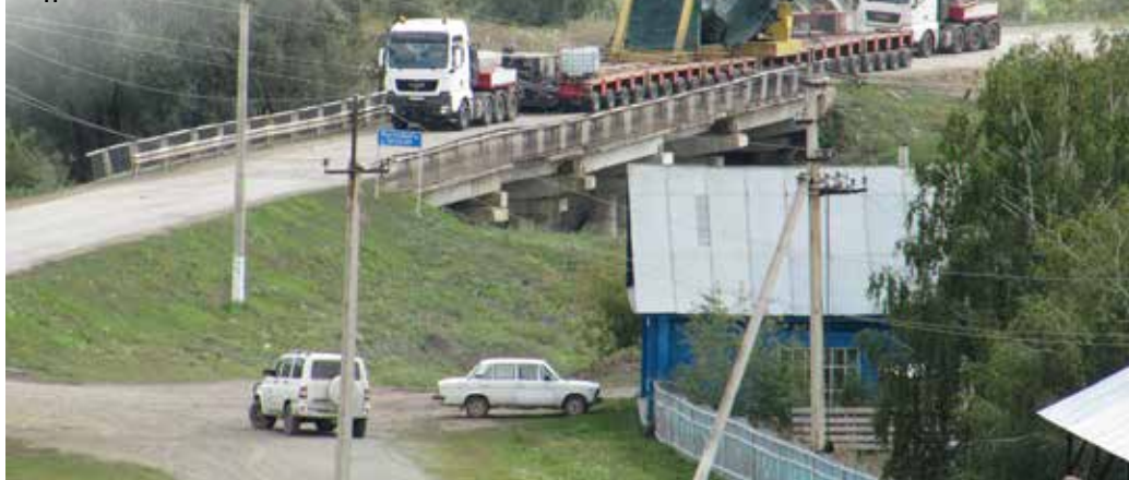
«Белуга Проджектс Лоджистик»